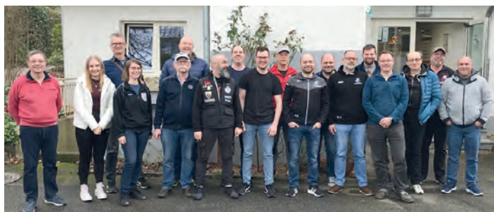
Das obligatorische Abschlussbild der Teilnehmer des Schießsportleiterlehrgangs

Mit dem Schießsportleiterlehrgang sind nun die Voraussetzungen für die Weiterbildung zum Trainer C Breitensport Kugel (Gewehr/ Pistole) im Oktober gelegt.