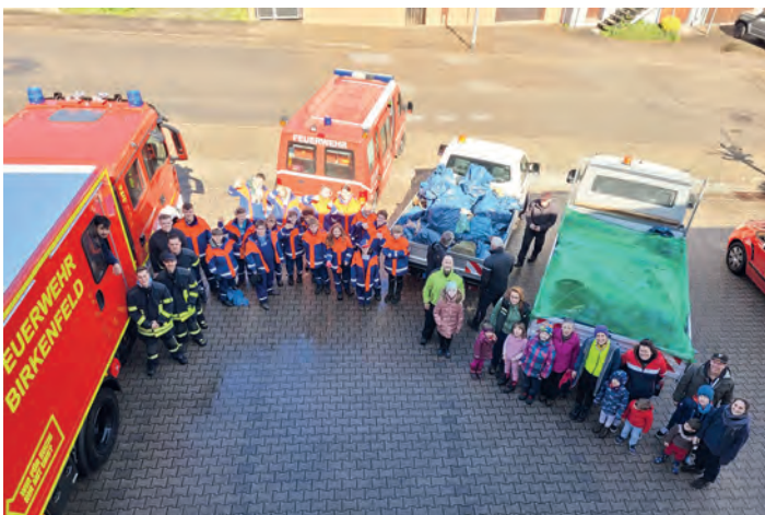
Jugendfeuerwehr Birkenfeld und Schwarzwald Verein Birkenfeld-Gräfenhausen

Unsere Wälder und Wiesen von Müll befreien: Das war erneut das Ziel der Jugendfeuerwehr Birkenfeld und des Schwarzwaldvereins Birkenfeld-Gräfenhausen bei der diesjährigen Waldputzete. Dazu wurde in beiden Ortsteilen hunderte Kilo Müll eingesammelt, z.B. an Waldparkplätzen, Parkbuchten und Wegen. Die Jugendfeuerwehr Birkenfeld war mit mehreren Betreuer und Jugendlichen an der Aktion beteiligt. Zum Schluss gab es für alle noch ein gemeinsames Essen im Feuerwehrhaus Birkenfeld. Wir danken allen Beteiligten für ihre Unterstützung.