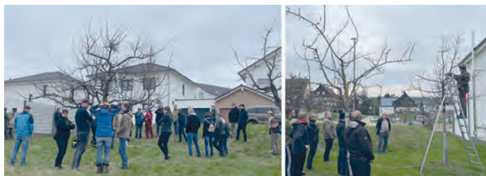
Links: Pflegeschnitt an einem Altbaum, rechts: Erziehungsschnitt an einem Jungbaum

Bei Fragen zum Obstbaumschnitt stehen wir Ihnen gerne per Mail unter KellerObstundGarten@vodafone.de zur Verfügung.